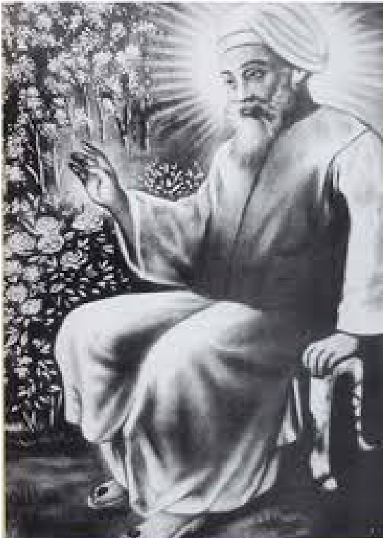
GURU NANAK SAHIB JI (1469-1539) Guru Nanak, during his fourth missionary journey to Muslim Countries, arrived in Baghdad, Iraq in January 1538 (1531 A.D.). This portrait of Nanak Sahib Ji was painted by a Muslim artist in Baghdad.

ਧਰਮ ਦਾ ਰੰਗ ਮਾਨਣ ਵਾਲਿਆਂ ਨੂੰ ਹਰ ਦਿਲ ਵਿਚੋਂ ਰਬ ਦਿਖਾਈ ਦਿੰਦਾ ਹੈ। ਆਪਾ ਵਾਰਨਾ ਤੇ ਦੂਜਿਆਂ ਲਈ ਕੁਰਬਾਨ ਹੋਣਾ ਧਰਮੀ ਬੰਦੇ ਦੀ ਨਿਸ਼ਾਨੀ ਹੈ। ਸੰਤਾਂ ਦੀ ਪਛਾਣ ਕਰਵਾਉਣ ਲਈ ਸਵਾਮੀ ਵਿਵੇਕਾ ਨੰਦ ਜੀ ਕਹਿੰਦੇ ਸੀ ਕਿ ਕਿਸੇ ਦਾ ਦੁੱਖੀ ਬੰਦੇ ਦਾ ਦੁੱਖ ਦੇਖ ਕੇ ਸੰਤ ਦਾ ਦਿਲ ਰੋਂਦਾ ਹੈ। ਪਰ ਇਹ ਕਿਹੋ ਜਿਹੇ ਲੋਕ ਸੀ ਜਿਹੜੇ ਭਗਵੇਂ ਵੇਸ ਵਿਚ ਸੋਭਦੇ ਹੋਏ ਬੇਬਸ ਰਹੀਮ-ਭਗਤਾਂ ਦੀਆਂ ਅੱਖੀਆਂ ਵਿਚ ਹੰਝੂ ਦੇਖਦੇ ਹੋਏ ਭੀ ਉਨ੍ਹਾਂ ਦੇ ਰੱਬ ਘਰ ਨੂੰ ਢਾਹ ਰਹੇ ਸੀ, ਖੁਸ਼ੀਆਂ ਮਨਾ ਰਹੇ ਸੀ ਤੇ ਨੱਚ ਰਹੇ ਸੀ।